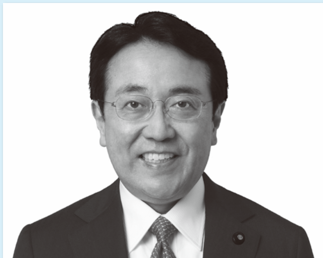
経済産業大臣 衆議院議員 赤澤 亮正 先生