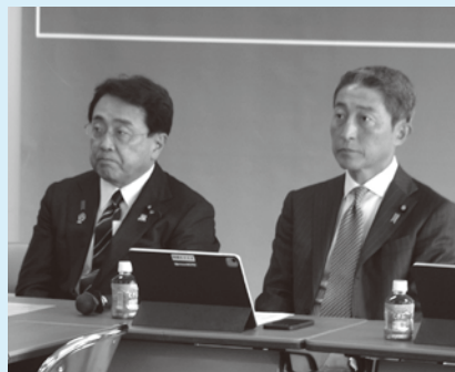
自民党 米国の関税措置に関する総合対策本部